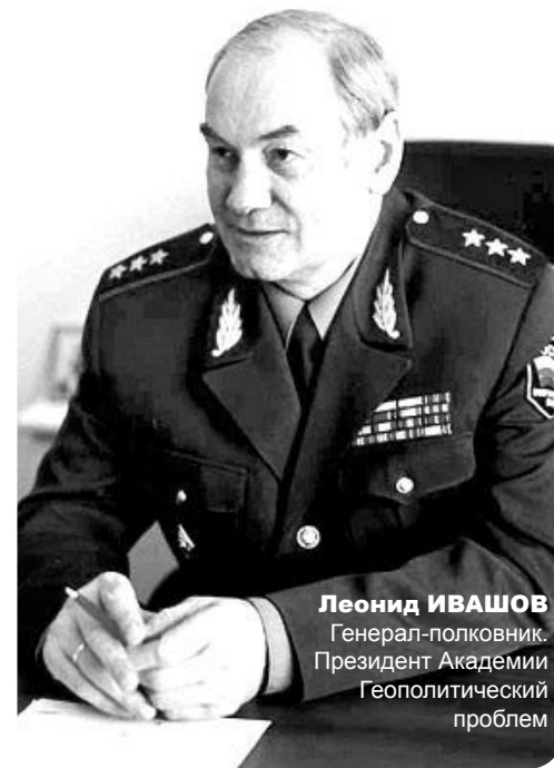
Леонид ИВАШОВ Генерал-полковник. Президент Академии Геополитической проблем

Корр. Ф: Появился еще один беспокойный регион - Абхазия, где буквально за сутки произошел государственный переворот с участием совершенно непонятной «оппозиции». Кто эти люди и почему, по-Вашему, это происходит в Абхазии сейчас?