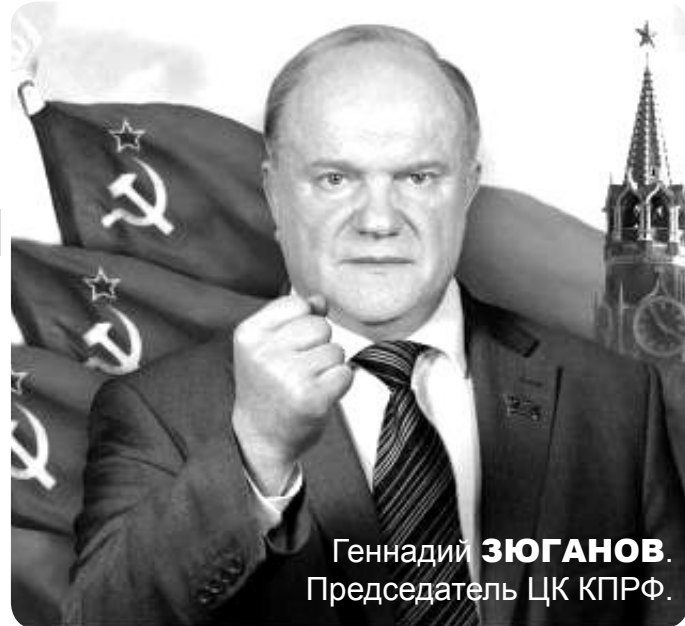
Геннадий ЗЮГАНОВ. Председатель ЦК КПРФ.

Ответственность за государственный переворот в Киеве и последовавшую за ним братоубийственную войну полностью несут США и Евросоюз. Поддерживая неонацистскую диктатуру, они способствуют проведению этнической чистки – одного из тяжчайших преступлений против человечности. Нынешний бандеровский режим