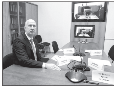
Николай Николаевич, участники Совета!

Попробую обратить ваше внимание на те задачи, которые были поставлены Указом Президента. Так, в частности, в пункте 7 обращается внимание на то, что надо решать вопросы повышения качества питьевой воды, говорится об экологическом оздоровлении водных объектов, об экологической реабилитации водных объектов (и р. Волга в том числе), говорится о сохра-