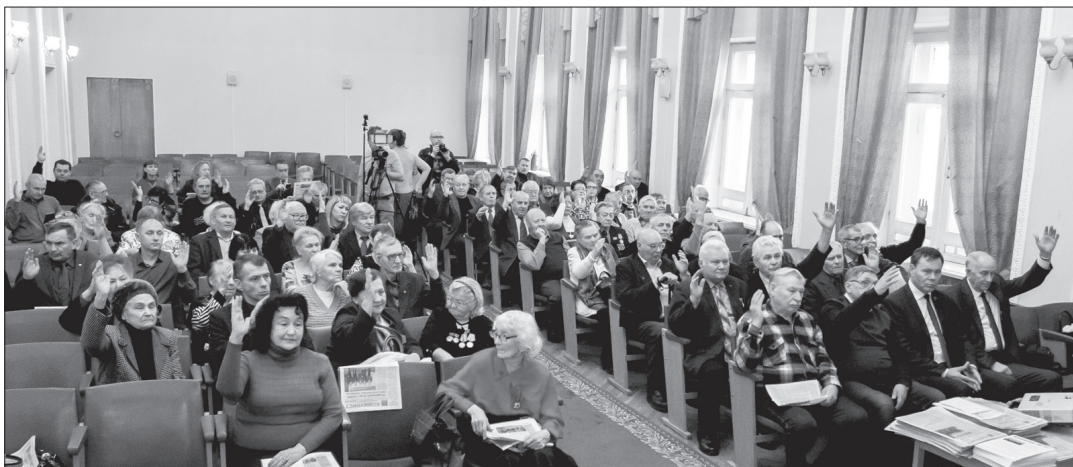
Собрание голосует за выборы исполкома Совета.

А взять муниципальный уровень. Камень преткновения тут федеральный закон №131. Реформа МСУ, которая проводится и в Курганской области, создает для власти дополнительные возможности для обмана населения. Полномочия сверху муниципалитетам все добавляются, а финансово-экономические возможности мизерные. Капканом для депутатов сельских и поселковых дум стала декларация о доходах, которую усердно продвигали депутаты-единороссы в Госдуме, а потом спохватились и обратно этот вопрос задвинули.