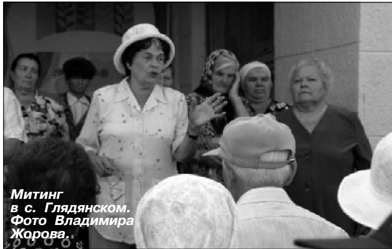
Митинг в с. Глядянском.

НЕСМОТЯ НА ЛЕТНИЙ ПЕРИОД, НАЧИНАЕТ НАРАСТАТЬ ПРОТЕСТНАЯ АКТИВНОСТЬ В ЗАУРАЛЬЕ. НА ДНЯХ АКЦИИ ПРОТЕСТА ПРОТИВ НАРУШЕНИЯ СВОИХ ИНФОРМАЦИОННЫХ ПРАВ И ПРОТИВ ПОВЫШЕНИЯ ЦЕН НА ХЛЕБ ПРОВЕЛИ КОММУНИСТЫ СЕЛА ГЛЯДЯНСКОГО – РАЙОННОГО ЦЕНТРА ПРИТОБОЛЬНОГО РАЙОНА КУРГАНСКОЙ ОБЛАСТИ.